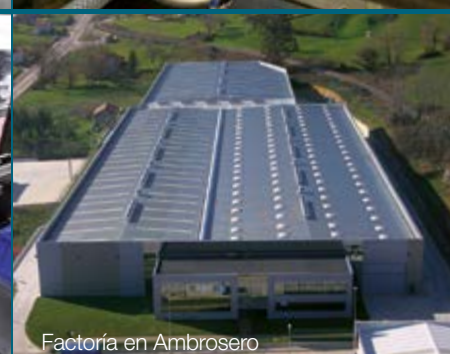
Factoría en Ambrosero