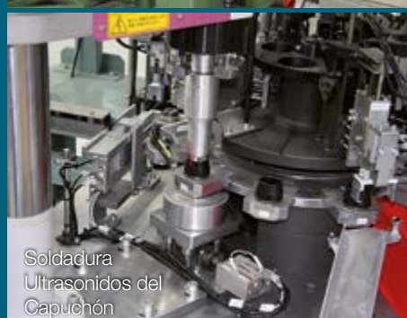
Soldadura Ultrasonidos del Capuchón