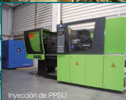
Inyección de PPSU